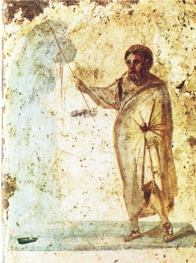
Mozes bij de rots Muurschildering catacomben van Petrus en Marcellinus. Rome eind 3e eeuw,